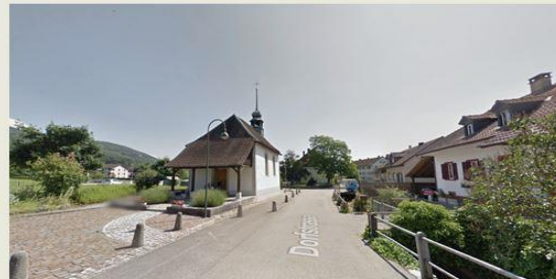
Kapelle St. Laurentius